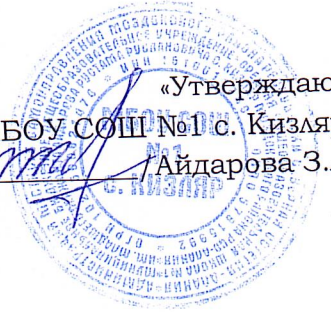
График работы воспитателей Весеннего оздоровительного лагеря «Солнышко» МБОУ СОШ № 1 с. Кизляр 2025г